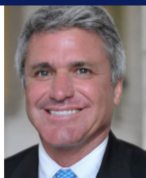
(R) MICHAEL MCCAUL*