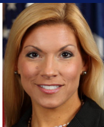
(R) BETH VAN DUYNE